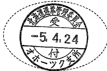
( 受 付 印 )