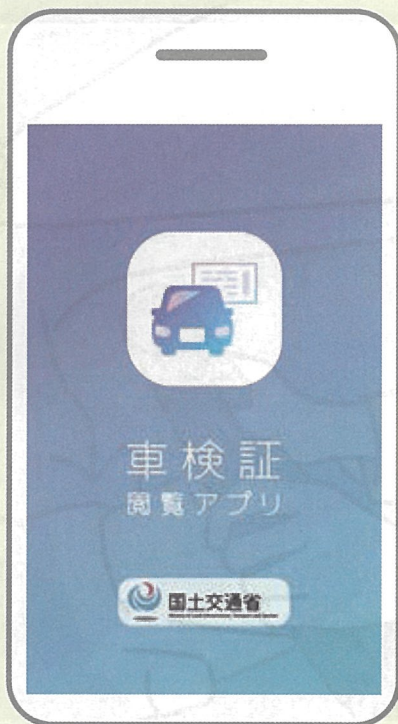
車検証閲覧アプリ