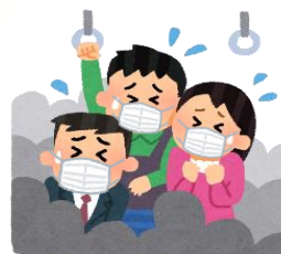
混雑した乗り物の中