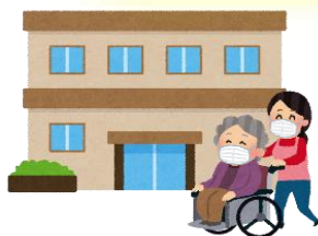
高齢者施設など に行くとき