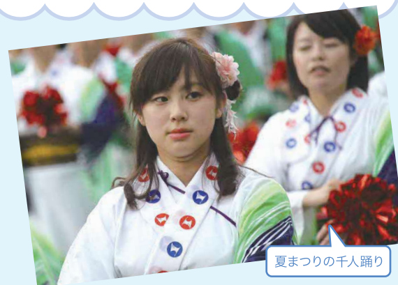
夏まつりの千人踊り

オホーツクは「自然が豊かで、空気がおいしい」と地元を離れてあらためて思います。大学が室蘭で工業都市だったので、余計にその差を感じました。 住んでいる人たちの人柄もおおらかで、とても優しい人たちが 多いですね。地元だと、お客様とお話しをするときに、共通の話題もありますし、 地域のことをよく知っているので会話がしやすい です。