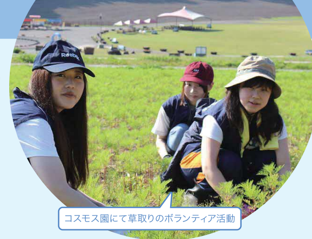
コスモス園にて草取りのボランティア活動