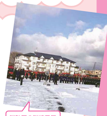
消防団の訓練風景

網走の消防団に入っていて、高校に講習などのお手伝いに行くこともあります。 出身校の学生といろいろな関わりが持てるのも楽しいですね 。消防団のつながらず地元のお祭りに参加することも。プライベートでも地域のイベントには積極的に参加しています。地域のお祭りを作っているのは、ほとんどが地元の人たち。今度は、 作る側としても参加してみたいです 。