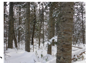
天然林間伐計画地