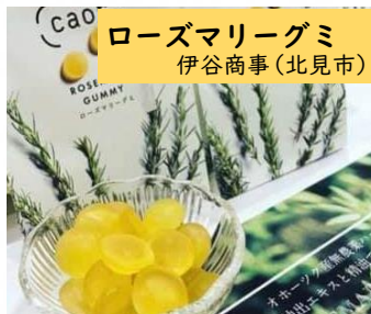
ローズマリーグミ 伊谷商事(北見市)