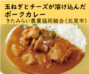
玉ねぎとチーズが溶け込んだ ポークカレー きたみらい農業協同組合(北見市)