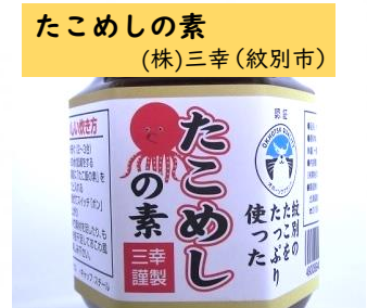
たこめしの素 (株)三幸(紋別市)