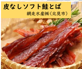
皮なしソフト鮭とば 網走水産(株)(北見市)