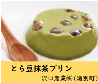
とら豆抹茶プリン 沢口産業(株)(湧別町)