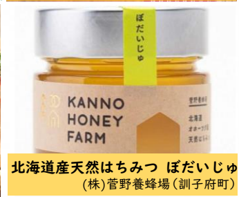
北海道産天然はちみつ ぼだいじゅ (株)菅野養蜂場(訓子府町)