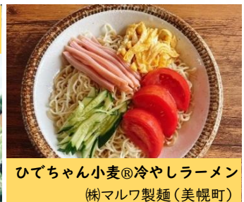
ひでちゃん小麦®冷やしラーメン (株)マルワ製麺(美幌町)