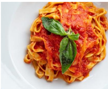
Basicトマトソースと 生パスタの1食セット たまごのじかん(北見市)

北海道の北東部、1月下旬~3月にオホーツク海が流氷に覆われるオホーツク地域は、収穫量全国1位の玉ねぎ生産をはじめとした畑作や酪農など、広大な土地を活かした農業を展開し、水産業では、オホーツク海沿岸を漁場とするホタテの増殖やさけ魚を中心に全道1位の漁獲量となっています。