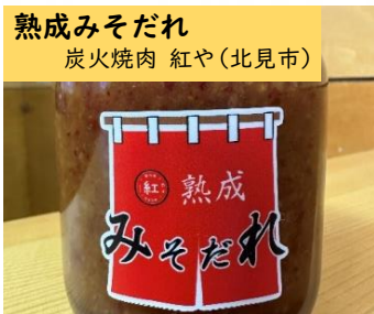
熟成みそだれ 炭火烧肉 紅や(北見市)