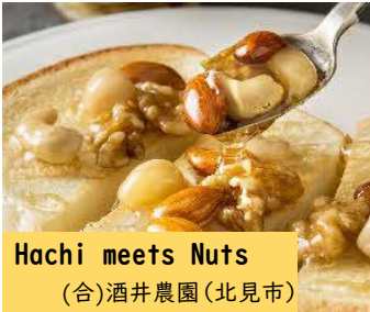
Hachi meets Nuts (合)酒井農園(北見市)