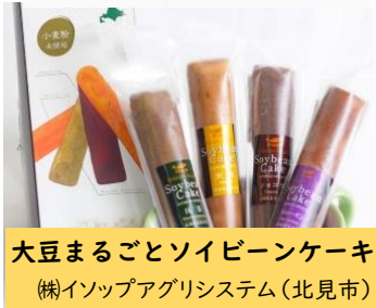
大豆まるごとソイビーンケーキ (株)イソップアグリシステム(北見市)