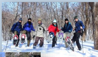
スノーシュー体験