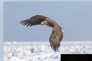
バードウォッチング